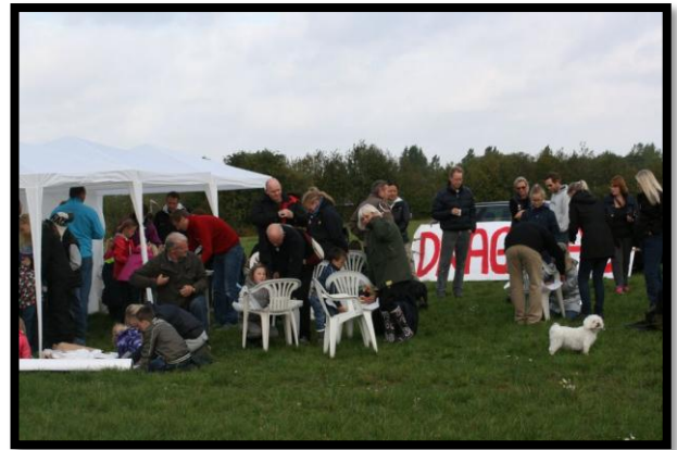
Der var rigtig mange mennesker på dagen