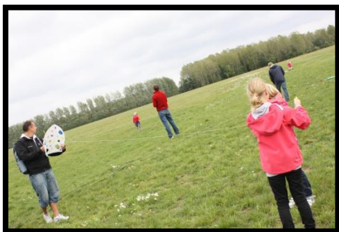
De første er på vej op.