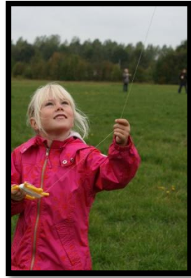
Se den flyver