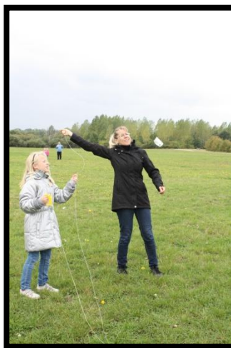
Man skal holde tungen lige i munden