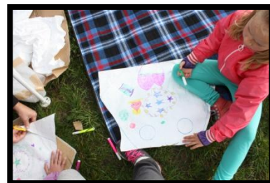
En meget flot drage