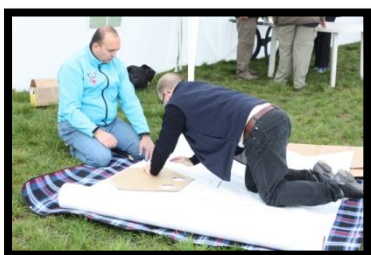
Dragerne tegnes op