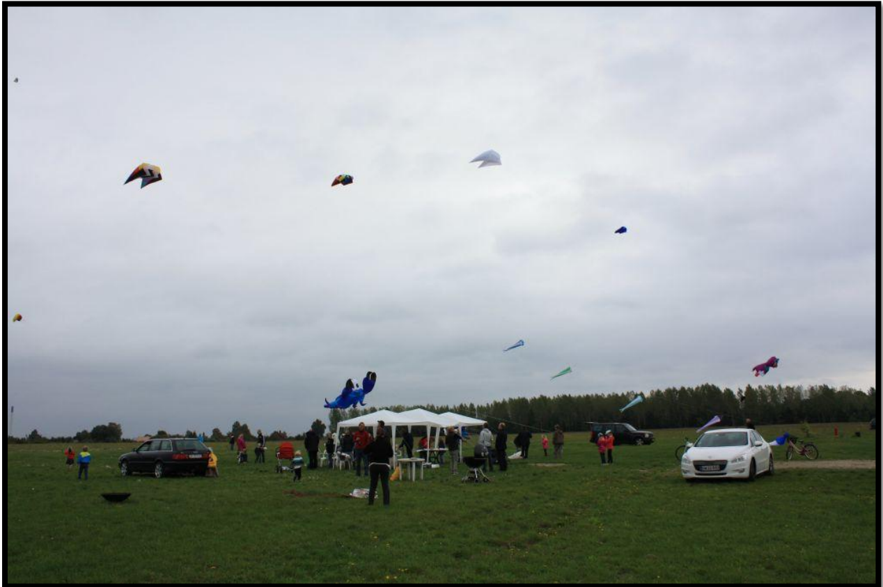
Rigtig mange drager i luften