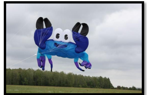
Drageklubbens store drager i luften