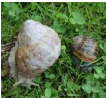
Sammenligning Vinbjergsnegl og plettet voldsnegl

Voldsneglens hus er også mørkere end vinbjergsneglens.